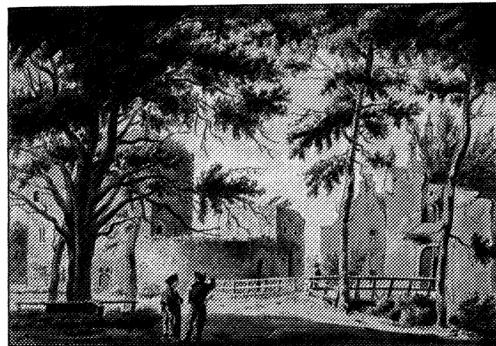
24. Tekening van de Ruïne van Teylingen, eind achttiende eeuw.

In 1839 deed Jacob van Lennep een dappere poging tot eerherstel (die overigens ook gericht was tegen Bilderdijs aanval op Jacoba). Hij publiceerde een dichterlijke weeklacht, getiteld Jakobaas weeklacht op het huis te Teylingen waarin hij de gravin liet