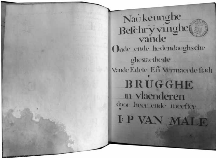
Titelpagina van Jan Pieter van Male, Naukeurighe Beschrijvinghe . Brugge, Openbare Bibliotheek, Hs. 432

In de Stadsbibliotheek van Brugge wordt een omvangrijk handschrift bewaard met de Naukeurighe Beschrijvinghe vande Oude ende hedendaeghsche ghestaethede Vande Edele Ende Vermaerde stadt Brugghe in Vlaenderen .