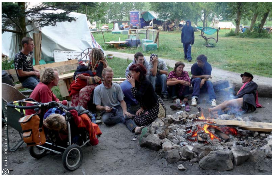
Ruigoord is nog steeds een plek voor festivals als F*ck MiNimal, Go MaXimal! (op de foto) en Landjuweel. Wonen mag je er niet meer, kamperen wel.

Na zijn juridische overwinning durfde minister van Defensie Frederiksen als eigenaar van het gebied toch niet over te gaan tot ontruiming en herontwikkeling. Hij ging onder-