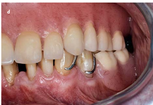
Afb. 3. Esthetisch verantwoorde ankerarmen. a. Studiemodel met pijlers met ongunstige meetlijnen voor correctie ('hoge' meetlijnen). b. Werkmodel na contourcorrectie in de mond. c. Werkmodel met metaaldeel frameprothese. d. Frameprothese in situ .