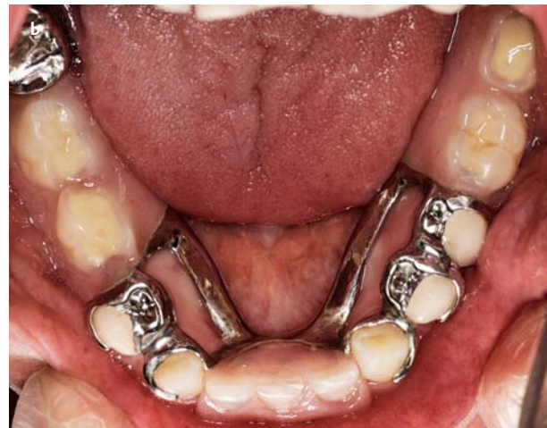
Afb. 4. Beperken van het aantal minor connectors. a. Werkmodel met doorlopende linguale ankerarmen op de gebitselementen 34 en 33. b. Frameprothese met minor connectors die uitsluitend uit de zadeln komen en daardoor niet de marginale gingiva kruisen.

tegen het pijlerelement aanliggen. Dit heeft tot gevolg dat vaak een correctie van de contour nodig is om een bijna recht vlak evenwijdig aan de inzetrichting te realiseren voor optimale stabiliteit.