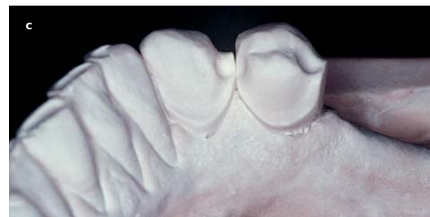
Afb. 6. Frameprothese met 'inlaid' verankering op de gebitselementen 34, 43 en 44 (a en b) en werkmodel met vormgeving van de uitsparing (c).

al, 1996; Creugers en Kreulen, 2003; Van Loveren, 2009). De primaire vragen zijn dus niet alleen of en hoe ontbrekende gebitselementen kunnen worden vervangen, maar vooral door welke maatregelen verder gebitsverval kan worden voorkomen (Petridis en Hempton, 2001).