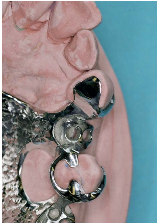
Afb. 2. Een palatinaal plaatje als occlusale steun bij een cuspidaat in de bovenkaak in geval van tekort aan interocclusale ruimte met articulatie over het palatinale vlak.

Eerder is gesteld dat de retentie van een frameprothese niet