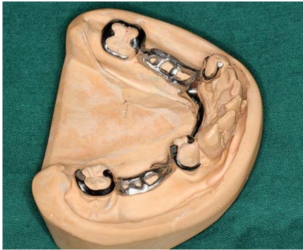
Afb. 1. Minor connectors ter plaatse van geleidingsvlakken distaal van de gebitselementen 33 en 44 en mesiaal van de gebitselementen 38 en 48.

vlak voldoende geacht omdat ook andere delen van het anker die boven de meetlijn liggen, bijdragen aan belasting in de richting van de lengteas van het pijlerelement. Echter, bij ver naar mesiaal gekantelde gebitselementen, hetgeen vaak wordt aangetroffen bij alleenstaande molaren, is het essentieel een distale occlusale steun aan te brengen. In combinatie met de overige delen van het anker wordt hierdoor de kans op verdere kanteling van het gebitselement kleiner.