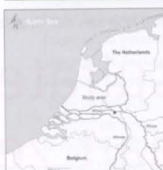
Fig. 1: Study area location