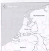
Fig. 1: Study area location