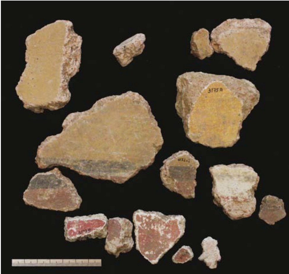
Afb. 6.38 Fragmenten met sporen van gele en rode banden of panelen en zwarte lijnen ertussen

ook een stuk dakmortel zijn, dat een gelijk-aardige samenstelling als het pleisterwerk heeft gehad. 293 Totaal oppervlak 15 x 17 cm.