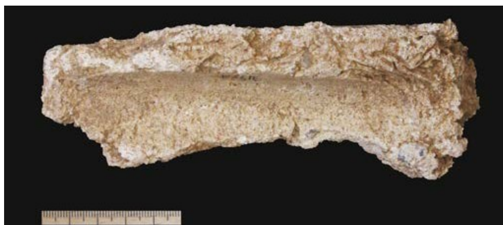
Afb. 6.40 Fragment van de afsmering met pleister van een hoek of bodemaanzet, mogelijk behorend bij de fragmenten van afbeelding 2