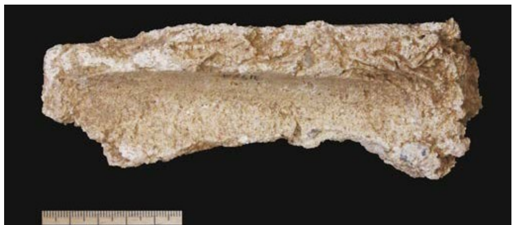
Afb. 6.40 Fragment van de afsmering met pleister van een hoek of bodemaanzet, mogelijk behorend bij de fragmenten van afbeelding 2