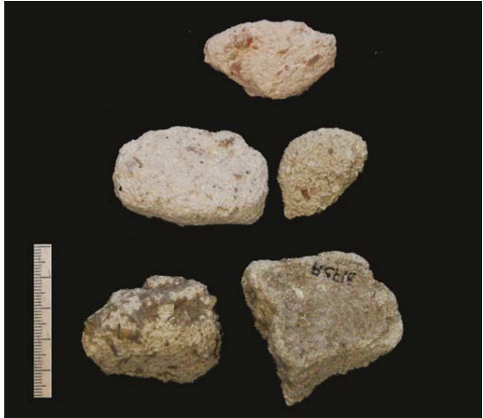
Afb. 6.42 Fragmenten zonder duidelijke resten van beschildering

heel gewoon. Heiligdommen en residentiële gedeelten van villae bevatten vertrekken met een Romeinse aankleding en inrichting waarvan wand- en vloerdecoraties vaste bestanddelen vormden. 300 Daarbij zijn er zelden aantoonbare verschillen tussen de decoraties uit heiligdommen en die uit woonhuizen. 301 Dat alleen geeft dan ook geen uitsluitsel over de functie van deze vindplaats. Het pleisterwerk lijkt er echter wel op te wijzen dat er sprake is van een binnen- en een buitendecoratie. Per slot van rekening komt een paneeldecoratie zoals die uit de gele en rode vlakken naar voren komt, eigenlijk alleen in binnenruimtes of eventueel halfopen, overdekte ruimtes voor, terwijl de voegenimitatie juist typisch is voor buitenmuren. Men zou zich dan ook kunnen voorstellen dat het imitatievoegwerk de omheiningmuur gesierd heeft, of misschien de buitenzijde van een klein gebouwtje dat zich binnen de omheining bevond, en zo enige monumentaliteit gaf aan het complex; het gebouwtje zelf zal dan aan de binnenzijde beschilderd zijn geweest met een eenvoudige paneeldecoratie.