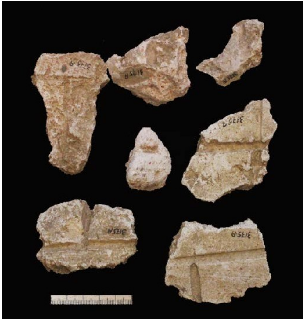
Afb. 6.39 Fragmenten van muurbekleding met inkepingen die muurwerk suggereren