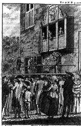
De publieke verbranding van De Post van den Neder-Rhijn

Bijna van week tot week wordt het politieke standpunt van De Post van den Neder-Rhijn geanalyseerd, gegroepeerd naar de verschillende zwaartepunten. Aanvankelijk ligt de nadruk op de buitenlandse politiek, met name de Vierde Engelse Oorlog, en wordt het blad gekenmerkt door een sterke anglofobie en de neiging tot het denken in politieke complottheorieën. Na het desastreuze verloop van de oorlog verschuift het accent echter naar de binnenlandse ontwikkelingen. Interessant is Theeuwen's analyse van de rol van De Post van den Neder-Rhijn in de patriottenstrijd in Utrecht, de thuisbasis van 't Hoen. Eerst stelt 't Hoen zich gereserveerd op tegenover het naar zijn oordeel al te snel met harde middelen door te drukken van de democratische eisen, bijvoorbeeld bij de revolutionaire journée van 11 maart 1785, wanneer patriotten de raadsmeerderheid onder dreiging met geweld